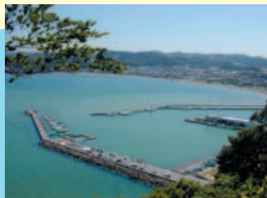
大房岬から眺める富浦湾