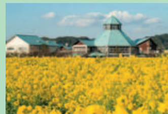
初夏の味覚・房州びわのシーズンは、5月中旬から6月中旬